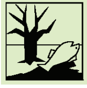
Peligroso para el medio ambiente